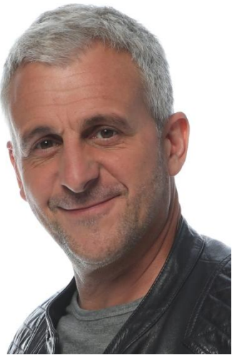
Patrick Huard : Ludovic Dessureaux, juge et père de Raphaël, Alicia et Gabrielle