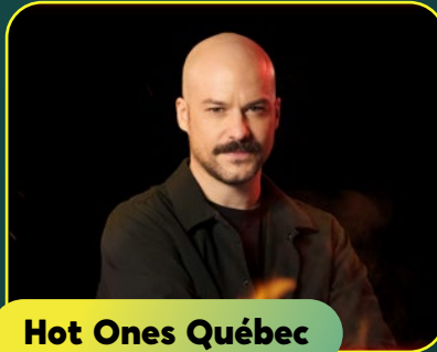
Hot Ones Québec