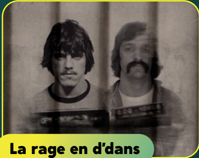
La rage en d'dans