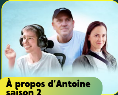
À propos d'Antoine saison 2