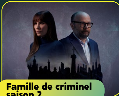
Famille de criminel saison 2