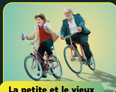
La petite et le vieux