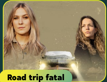
Road trip fatal