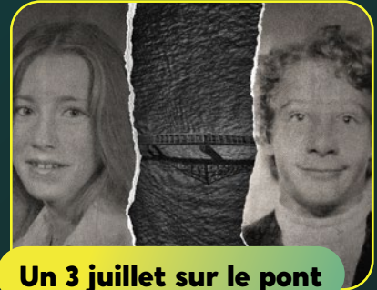
Un 3 juillet sur le pont